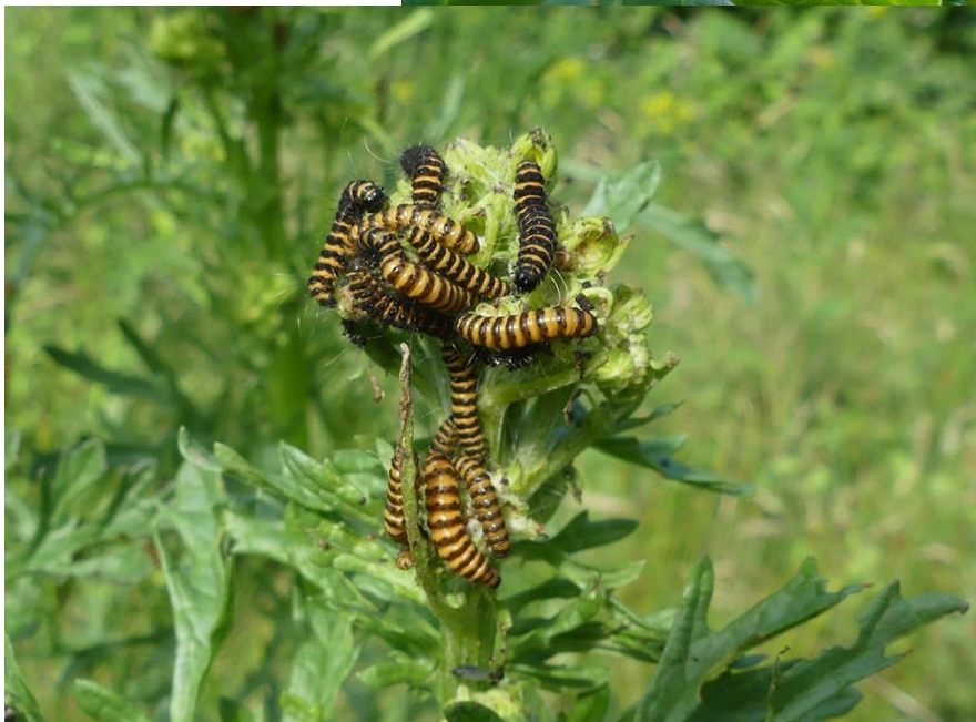
Zebrarupsen Sint-Jacobs- vlinder op Suthwalda in de eerste poel.