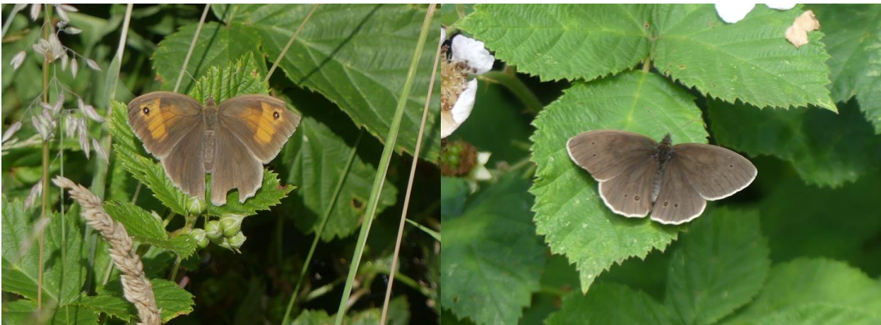
Bruin zandoogje en koevinkje op Suthwalda.

Vlinders: 8 bruin zandoogje, 1 atalanta, 2 groot dikkopje, 2 gamma-uil, 5 klein gaderd witje, 1 zilverstreep (micro), veel grasmotten, rupsen Sint-Jacobsvlinder, 1 koevinkje. Op bloemen van braam de vrij zeldzame gouden tor die kennelijk meeldraden eet. Veel zweefvliegen, niet nader gedetermineerd. En ook enkele sprinkhanen.