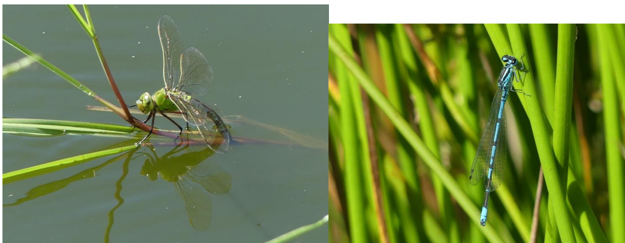
Eiafzet door vrouwtje grote keizerlibel en een mannetje azuurwaterjuffer

Vlinderidylle: De weelde aan bloeiende planten is overweldigend. In het water slechts één open plek. Op de rest drijft een dikke laag drab van algen. Het aantal insecten is zeer teleurstellend. Bedroevend! Eén Sint-Jacobsvlinder, 5 bruin zandoogje, 4 klein geaderd witje, 1 man gewone oeverlibel en heel vreemd, er is een vrouwtje steenrode heidelibel. Hopelijk komen hier in juli en augustus meer soorten heidelibellen. Blijft dat de weelde aan wilde planten erg mooi is met enkele orchideeën als krenten in de pap. Hier wel zebrarupsen.