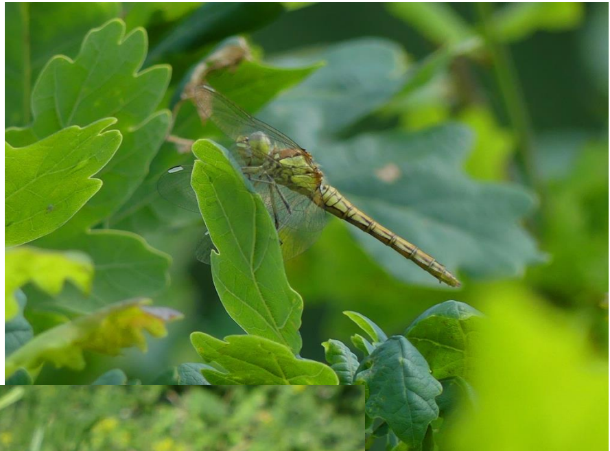
Vrouwkje steenrode heidelibel, Vlinderidylle.