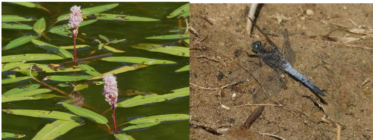
Veenwortel en mannetje gewone oeverlibel op Stiggeltie

Vlinders: 10 bruin zandoogje, 2 dagpauwoog, 4 klein geaderd witje.