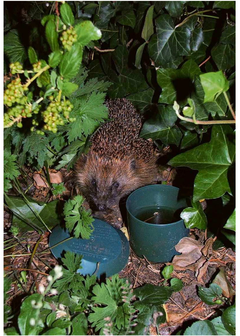
Een van de twee egels in onze achtertuin. Hero Moorlag

in de (groente)tuin. Dus alstublieft geen slakkenkorrels gebruiken! Wil je ze zien, leg dan een paar katten- of hondenbrokjes in de tuin en een bakje water, nooit melk. Maak in de hoek van de tuin een stapel van takjes, bladeren en plantenafval of koop een egelhuisje. Een overbuurvrouw heeft zo'n huisje in de tuin. Een egel komt daar elke