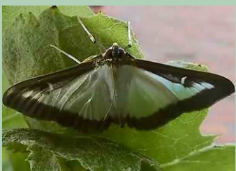
Buxusmot. Hero Moorlag

In Hoogeveen grijpt de buxusmot behoorlijk om zich heen. De plaag lijkt erger dan die van de eikenprocessierups. De rupsen eten complete struiken kaal. Er zijn mensen die de struiken maar uitspitten en in de container versnipperen. 's Avonds zie je de nachtvlinders op bloeiende struiken. Naast een tiental gamma-uiltjes peuren ook buxusmotten nectar uit de bloemen. Het is beter geen gif te spuiten op buxusstruiken. Zet de hoge drukspuit erop. Je spoelt de rupsen van de struiken. Ze sterven onder de sterke straal.